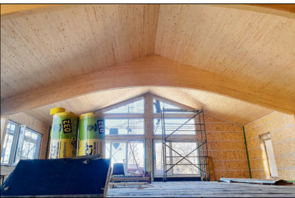
Wo früher das Jugendcafé war, geht es künftig aufs Tanzparkett.